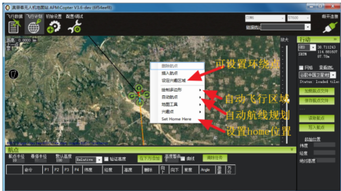
图三、飞行计划界面

具可以下载离线地图，按住 Alt 键的同时左键框选区域，然后点击右键在地图工具选择“读取”，也可以设置自动航线后，点击“预读取航点路径”，可预读取自动航线路径上的地图。