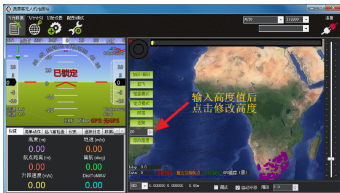
图二、飞行数据界面

2、飞行数据界面功能按钮如下图，点击起飞按钮之前，请确认飞行模式不是“Land”或“RTL”，起飞后自动飞至 5m 高度，输入高度值后，点击“修改高度”，即可完成高度修改，点击右键弹出“飞行至此”命令。