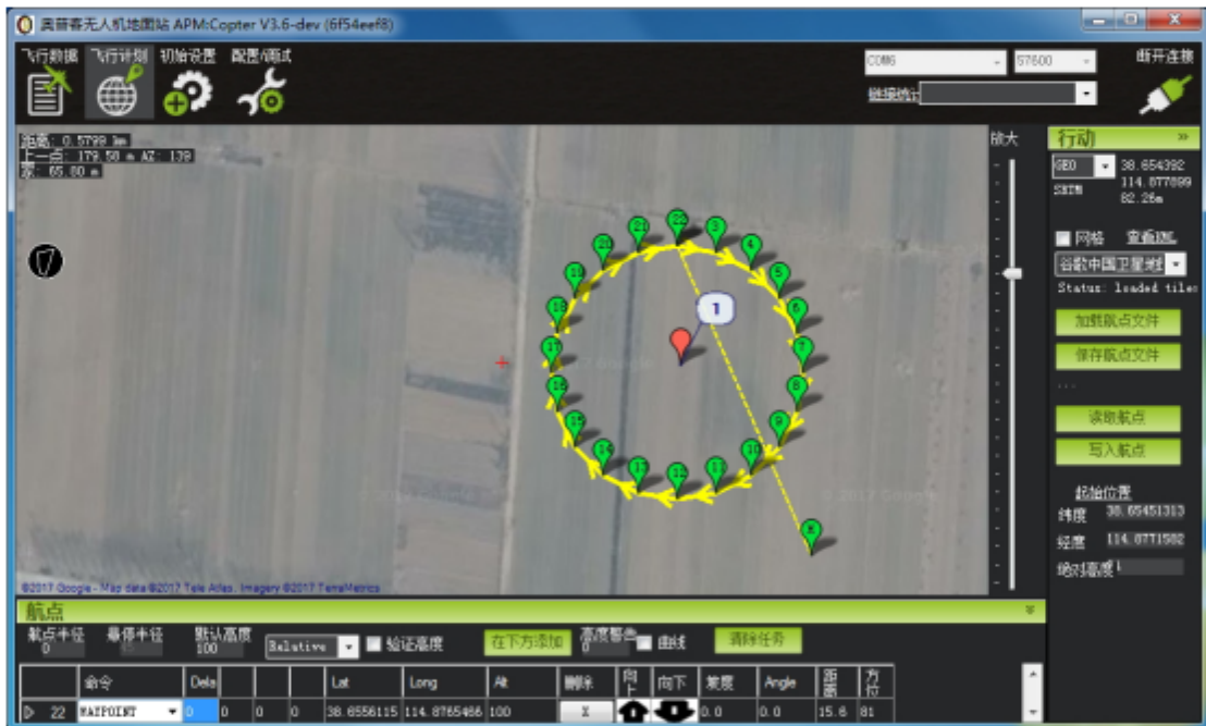
图八、移到正确位置