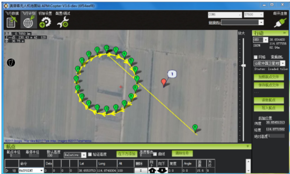
图六、完成航点圈创建